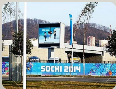
Металлоконструкции для трех светодиодных экранов (ТОИ) в г. Сочи