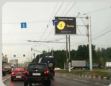
Металлоконструкции для 118 информационных светодиодных экранов (ТОИ) в г. Москва в рамках создания «Автоматизированной системы информирования участников дорожного движения»