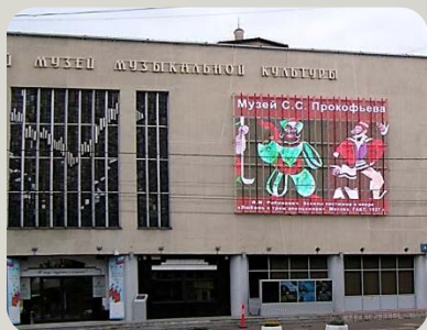
Медиафасад на фасаде музея музыкальной культуры им. М.И. Глинки г. Москва