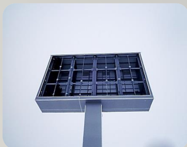
Металлоконструкция для светодиодного экрана в г. Новый Уренгой