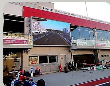
Металлоконструкции для четырех светодиодных экранов на трассе Moscow Raceway